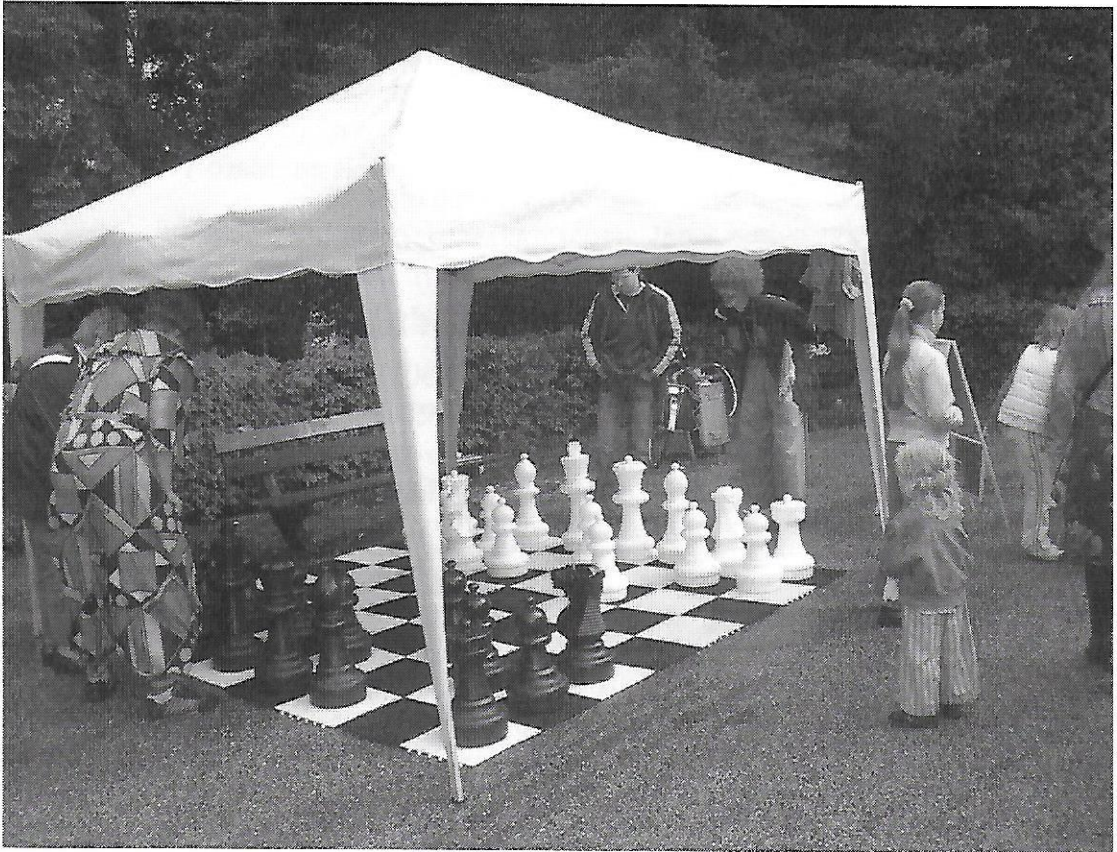
Schaken in het park