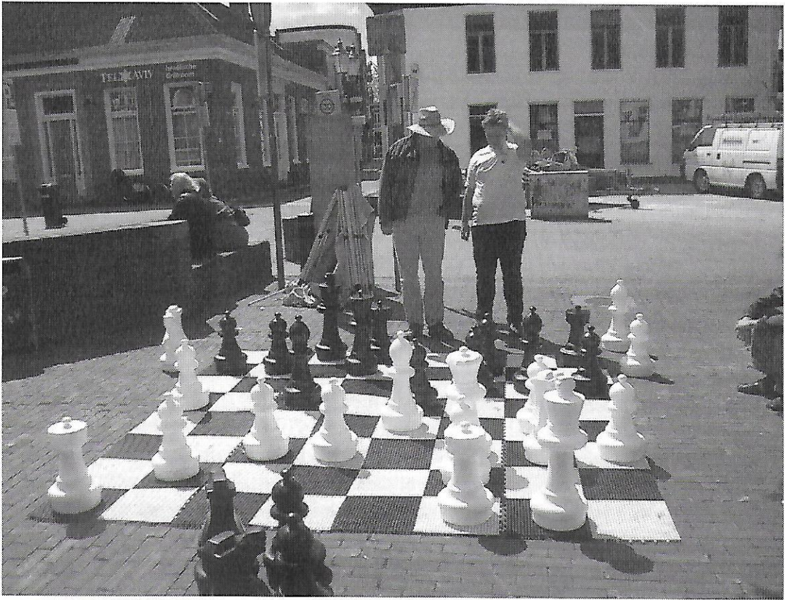
Schaken op marktplein