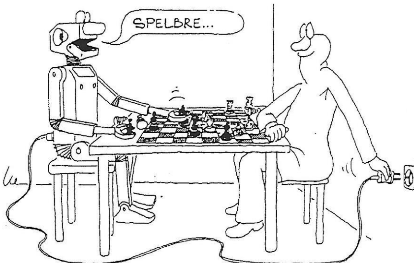
Mens tegen machine, vaak een ongelijke strijd.

De aanpassing vindt wekelijks plaats, zodat later in het seizoen gespeelde partijen zwaarder meetellen dan die uit het begin.